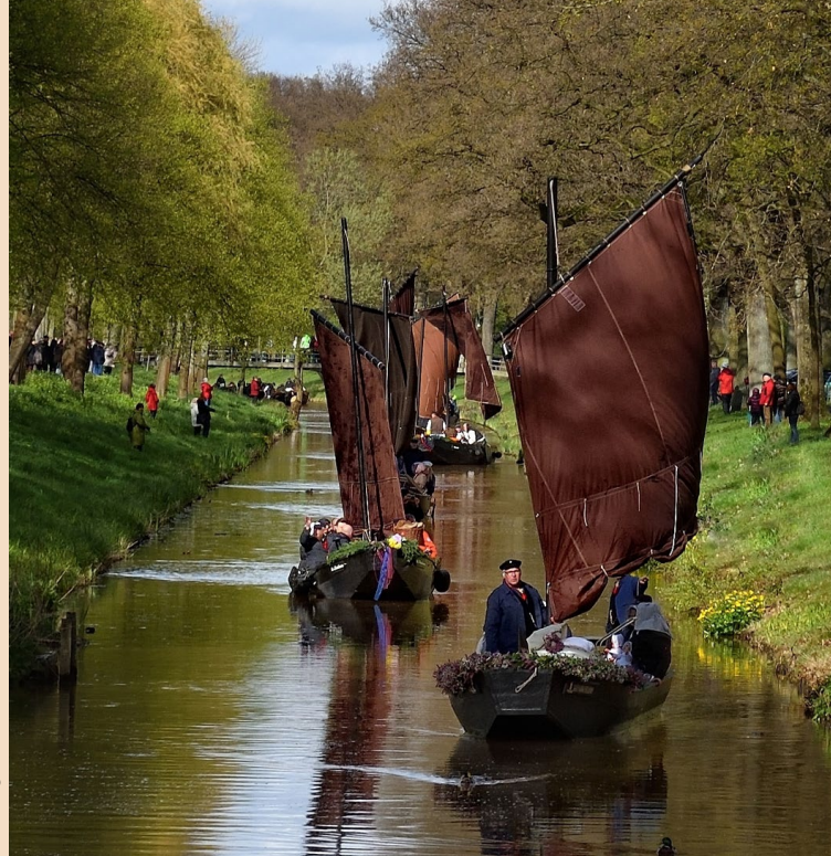
Gestaltung: studio 37 · Fotos: Renate Mann, Andreas Wilhelm

Die Angaben sind Schätzungen und überschneiden sich z. T. auf Grund von Schleusungen. Wir empfehlen, sich ca. 15 min vorher an den Orten einzufinden. Alle Angaben ohne Gewähr.