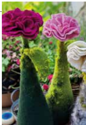
Türstopper-Blumen aus Filz