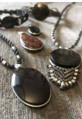
Kettenanhänger aus Obsidian