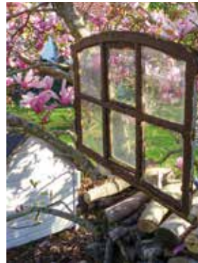
In Höltings Garten

Gästehaus Hölting · Mühlenstr. 3 · Lübberstedt