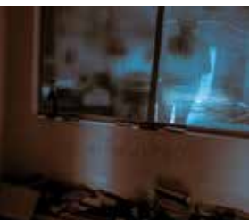
Besuch – bearbeitete Fotografie