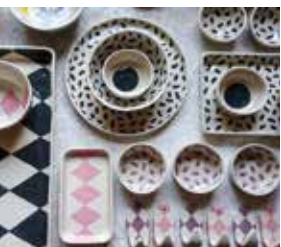
„RosalieBlack“, Keramik Steinzeug

Bahnhofstraße 3 · Axstedt Tel. 0176 - 831 036 06