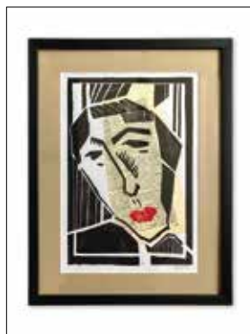
„Schlafend im Moor“ (2023), Holzschnitt, Handabzug