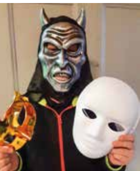
Hinter der Maske

Bremer Straße 4 · Hambergen Tel. 04793 - 7871 30 (AB)