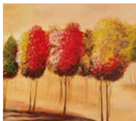
Der Herbst ist bunt

Am Jantzen Park 49a · Hambergen Tel. 04793 - 953 979