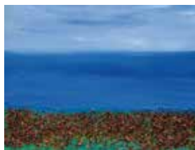
„Am Meer“ – Acryl auf Leinwand

Am Demmberg 2 · Hambergen Tel. 04793 - 2376