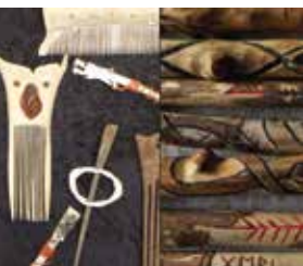
Arbeiten aus Knochen, Geweih und Holz