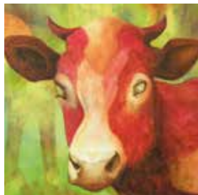
Rote Kuh 2023, Acryl-Mischtechnik