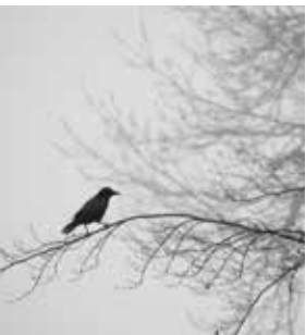
„The crow says nevermore“