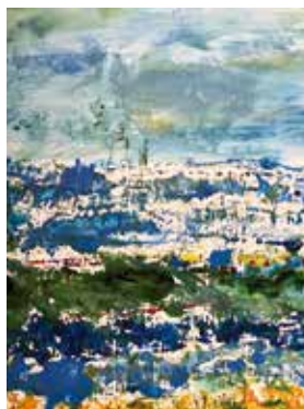
Impressionen in Blau 1

Wittenweg 3 · Hambergen Tel. 0170 - 774 3383