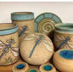
Anne Wellershaus, Libellenkeramik

Unter den Eichen 2a · Axstedt Tel. 0157 - 764 124 28