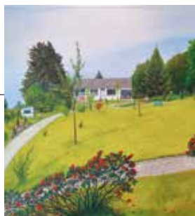
Haus in Hambergen

malt in Acryl-Farben. Das Farbspektrum ihrer Umgebung integriert sie sehr emotional in ihren Bildern. Sie malt gerne Landschaften und ist glücklich, wenn das Betrachten ihrer Bilder den Menschen ein Lächeln ins Gesicht zaubert.